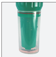
Измерение pH микрообъемов