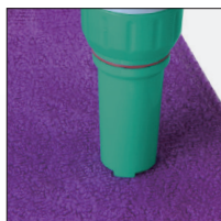
Измерение pH бумаги, текстильных изделий