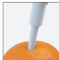
Измерение pH фруктов