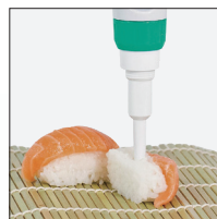
Измерение pH пищевых продуктов